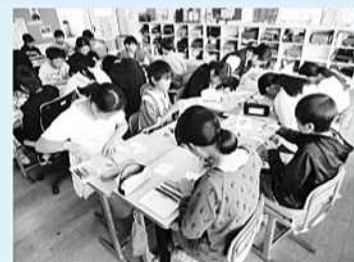
八街北小でしおりをつくります

さて、10月にはいり、街頭募金を実施。事前学習の中で学んだことを活かし呼びかけをしました。「この募金は八街を良くするために使われます」「被災地の支援金にもなります」ことばと一緒にお渡しするのは赤い羽根を使ったしおり。子どもたちからのメッセージ入りです。「募金して町の未来を支えよう」と中学生。小学校低学年は「ありがとう」自分のことばで自分の文字で心をこめました。