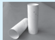
①トイレットペーパーの芯をとっておきましょう

材料はトイレットペーパーの芯。ならべたり、倒したり、コロコロシャカシャカ。アレンジしだいで何にでも変身!? さあみんなでおうち de ちゃれんじ。