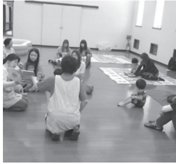
子育てサロンで親子もニコニコ