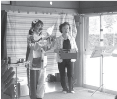
やちまたマジシャンズクラブ

ボランティアの発掘育成に努め、ボランティアが自主的かつ継続的に展開できるような基盤整備をすすめます。