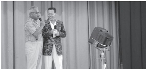
川上地区社協敬老会 同級生のかけあいに大爆笑

高齢者の長寿を祝い、広く敬愛の思想を普及するとともに、生きがいのある老後生活が送れるよう社会環境づくりを目指します。