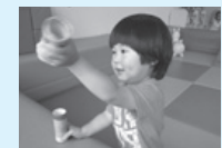
⑥ハッピーできあがり～