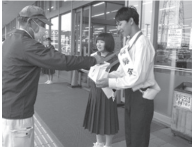
中学生の明るい呼びかけ街頭募金