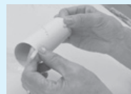
④両はじをとめます