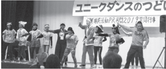
障がいがある人もない人も一緒に

全ての障がいがある人々が、ひとりのもれもなく、地域の人々の温かい協力によって明るい生活が保障されるような社会基盤づくりに努めます。