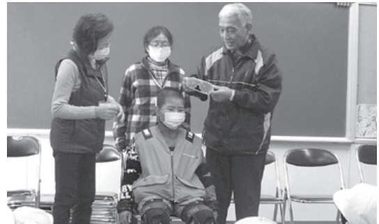
装具を着けて高齢者になってみよう