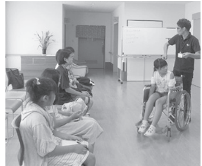
夏休みボランティア体験教室