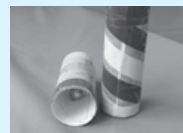
⑤カラーテープやマスキングテープをかざれば