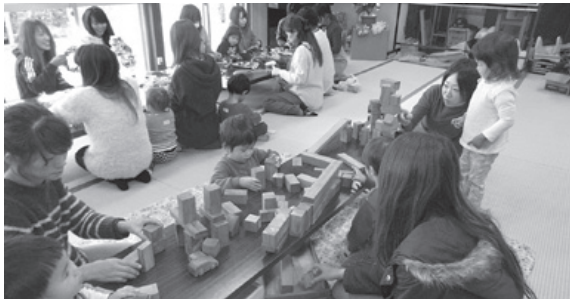
親子で楽しむ子育てサロン