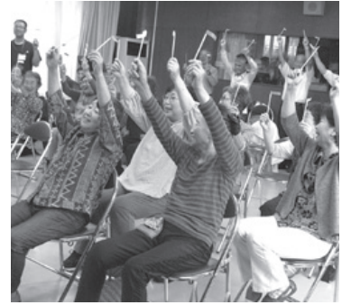
楽しく明るく シルバー健康サロン