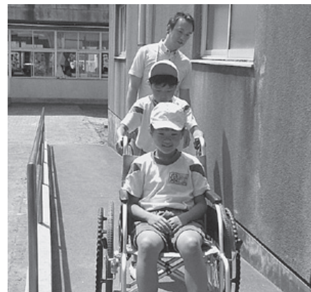
介護のプロに教わります