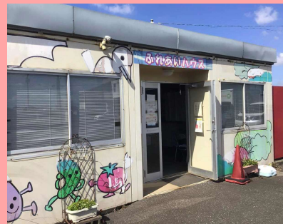
コミュニティハウス外観

ご提供いただいた食品は、八街市社会福祉協議会へ寄贈し、子ども食堂や生活にお困りの方などに無償で届けられます。