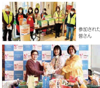
たくさんの食品を寄贈いただきました。同時に常設食品回収ボックスの周知も行いました