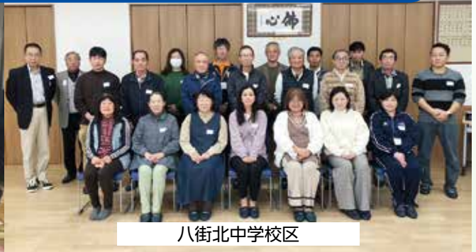
八街北中学校校区

八街市では、法定計画である地域福祉計画の策定に取り組んでいます。また、あわせて民間のアクションプランである地域福祉活動計画を一体的に策定し、車の両輪となって市民と行政が同じ方向を向いて地域福祉を推進していきます。