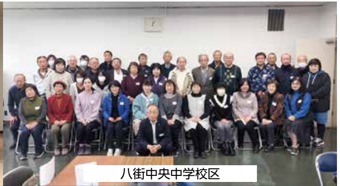
八街中央中学校校区