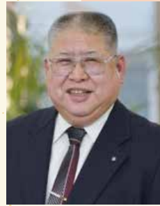
八街市社会福祉協議会