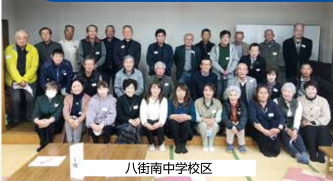
八街南中学校校区